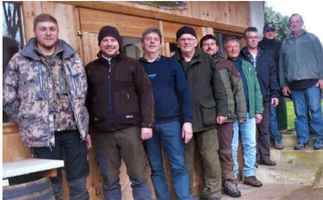
Jagdrevier Weißenberg