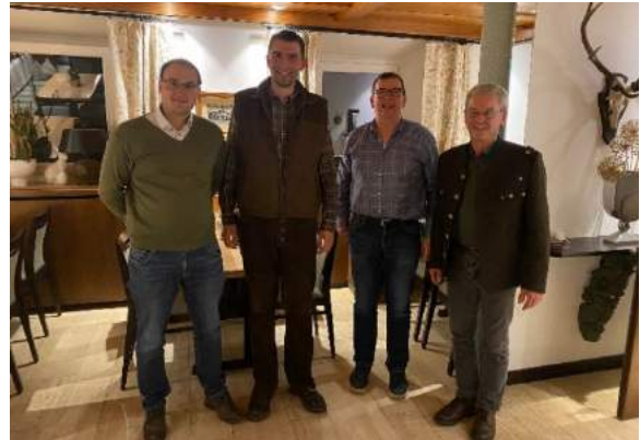
Jagdrevier Edelsfeld

In den Jagdrevieren Weißenberg und Edelsfeld gab es zum 01.04.2022 einen Pächterwechsel.